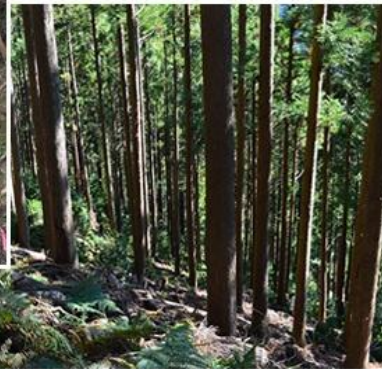
日光が地面に届かなくなる